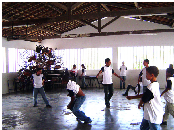
Imagem 04: Pátio coberto

A comunidade participa por considerar os projetos da escola de extrema importância para os alunos. Por isso, a escola precisa realizar atividades recreativas com fundamentos relacionados com o lazer, apresentando atividades com objetivos, pois... “nas tentativas de adaptação dos valores vivenciados no lazer com a prática educativa, tem-se confundido a orientação e a motivação, com um simples ‘deixar fazer’” (MARCELLINO, 2007, p. 97).